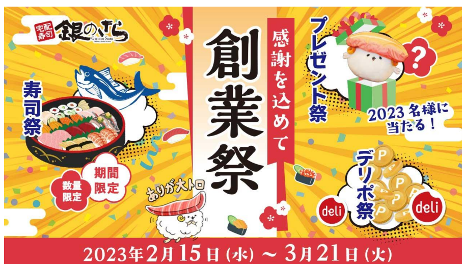
宅配寿司「銀のさら」創業祭キャンペーンを実施

サイト URL： https://www.ginsara.jp/campaign/2023_sougyousai/