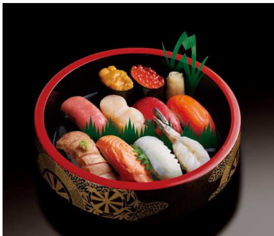
『感謝（かんしゃ）1人前』3,218円（税込）

今年、2025年は「銀のさら」25周年を記念して、母の日特別商品『感謝（かんしゃ）』に含まれる『生エビ』を、キャンペーン商品でも使用している『生車エビ』へとグレードアップいたしました。ぷりっとした弾力と濃厚な甘みが特徴の高級食材『生車エビ』は25周年にふさわしく、より贅沢で深みのある味わいです。