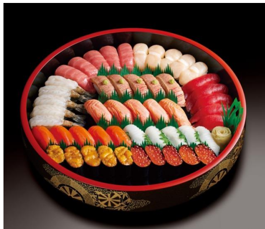
『感謝（かんしゃ）5人前』16,686円（税込）