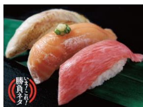
極上トロ3貫盛り 1,350円（税込）

公式 WEB サイト（ https://www.ginsara.jp/ ）限定販売商品として、『カマトロ』・『厳選炙り 上のどぐろ』単品と、それぞれ1貫ずつ入った『極上トロ3貫盛り』の3商品を販売します。