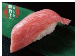
カマトロ（1貫） 648円（税込）