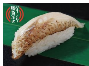
厳選炙り 上のどぐろ（1貫） 626円（税込）