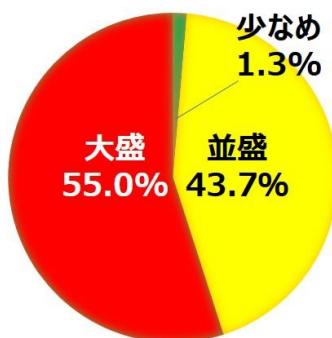
丼メニュー（全体）で注文されるシャリの量

「すし上等！」で人気の高い「丼メニュー」では、半数近くのお客様がシャリを“大盛”で注文し、特にネタを通常の2倍使用した『ダブル丼』をご注文されるお客様の55%が、シャリも大盛で注文していることが分かりました。（※ダブル丼の場合、大盛は無料）この傾向をもとに、「すし上等！」のお客様の中には、シャリもネタもお腹いっぱい食べたい方が多いのではないかと考え、今回、その“まんぷく感”を存分に感じていただける“まんぷく感上等！”なメニューの実現にいたりました。