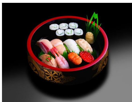
寿史に残る伝説 2,700円（税込）