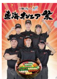
表面（第1弾、第2弾共通）

※オリジナルクリアファイルは数量限定のため、期間中であっても無くなり次第配布終了します。（コラボ桶の販売も終了）